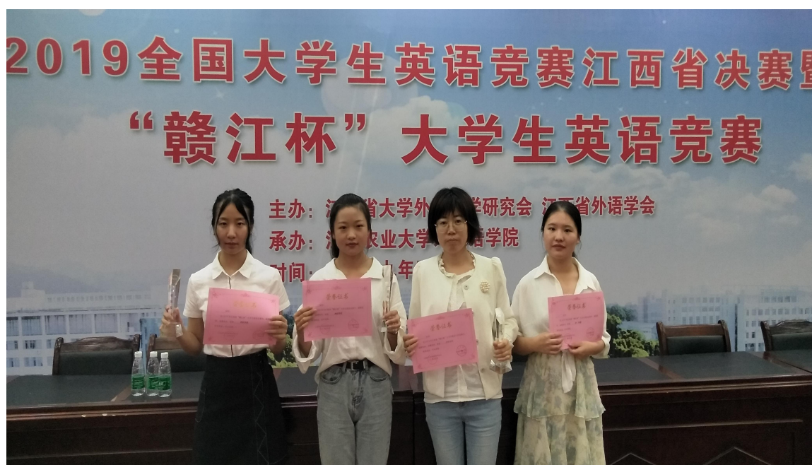
指导教师与获奖选手合影